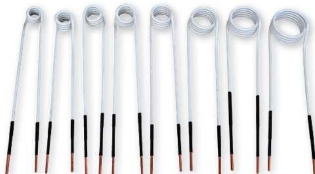
boční cívky - rozměry viz tabulka